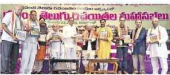
గమ్యం-గమను' వృద్ధార్ని ఆనివృదిస్తున్న మధీంకోర్మ పూర్ప చరాన క్రామమూర్తి ఆస్తిన్ ఎన్.పి.రమణ దిశ్రంలో పాలముకు లక్షండాన్ని, మండరి మధ్యవసార్, ఉదనకరుడ్ల, గరిగపాది నరకించారన్ని, అన్నవరన్న రావస్తాడి, వ్యక్తిపోరాలే, పుర్మాడ శవరామమిట్టర్, పుర్మాడ వేజుగోసార్, గుత్తికొండ ముఖ్యరాష

ಕನ್ನಡ-ಅಮರಸಕ್ 'ಮನ ಶಿಲಗು ಆರಿ ನಗ 86 කරයි ප්රිසාරවක්ෂණකලා දෙදන්වේ 88ට අම කරන පර සුකිනේස් නම් වරුණ nd. Burn and Soldigh Sugarded hard tio opidit, till biogen oo విద్ద గుర్తున్న తప్పక పర్వేమ 'అంట్రులు' సేవ వియమ కర్నా సాయకత్వం వహించిందుకో ఎక్కవ ఆతర పాష్ట్రమ్మారు, సమ్మ ఆయరమైన లేక రిమ్మించేందుకు సందేహిస్తున్నారు. దైతి తప్పుకు ఏడితా జిస్టప్పుడుక ప్రచుత్పిస్తున్నారు. మగ గరున పహిత్మగాడి రెప్పారు. ఆ సెస్టర్స్ బాస్ట్ల్ కేస్ తెల్లగుడాన అత్మగిరడాన్ని తెల్లికేస్ మన జాత స్టాగికికి తోడ్కడాకో అని సెట్టింకోట్ల Dece that arithme with all the Sessional de Silvatod Burk d'aude advices like when wedgen and యాలక ఆకిరంగా బాపా, సంస్కతి విషయంలో ఎంకమైనా పోరానే తమికులకు మరు అదర్భంగా Biotheric Seburdi eril, Soliya, ust the word biniof staf plan b ango and soon atoms, 'edging the most infestig day and experienced flagic Driver that stips of the de singular at stress of aired religions. జబ్జర్ మన శక్తి అని గుర్దికగాల్ మనం దద్దురాలు distriction of ook artic contests ουδόμ στομέτα. Τάμο είλητός μά