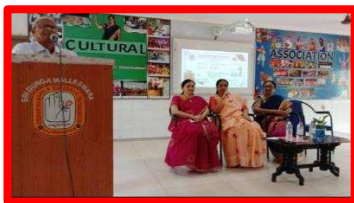
Guest addressing the gathering