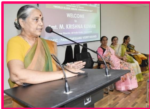
Guest Addressing Gathering